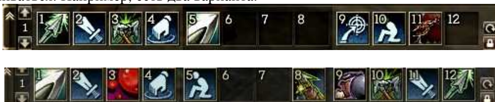
Раскладка сверху – привычная. Раскладка внизу – рекомендуемая.

К слову, после 40+ весьма рекомендуется немного переставить скилы на основной панели управления, поскольку придется не только насиловать мобов, но и от врагов отстреливаться. Например, есть два варианта.